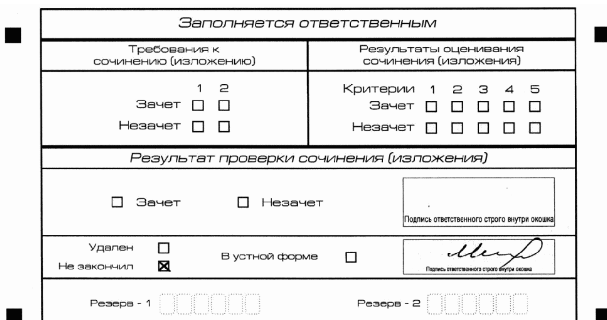
Рис. 12. Заполнение полей нижней части бланка регистрации (участник не закончил написание сочинения (изложения) по уважительным причинам)

написания итогового сочинения (изложения) по уважительным причинам" (форма ИС-08), вносят соответствующую отметку в форму ИС-05 "Ведомость проведения итогового сочинения (изложения) в учебном кабинете ОО (месте проведения)" (участник итогового сочинения (изложения) должен поставить свою подпись в указанной форме). В бланке регистрации указанного участника итогового сочинения (изложения) необходимо внести отметку "X" в поле "Не закончил" для учета при организации проверки, а также для последующего допуска указанных участников к повторной сдаче итогового сочинения (изложения) в дополнительные сроки. Внесение отметки в поле "Не закончил" подтверждается подписью члена комиссии по проведению итогового сочинения (изложения) (см. рис. 12).